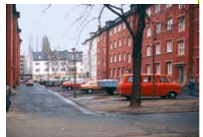
Straßenansicht vor der Sanierung