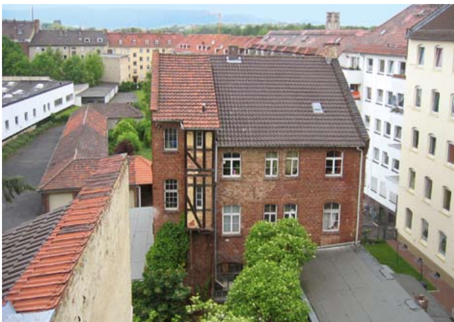
Standort des denkmalgeschützten Hauses in der Gottschalkstraße mit baulichem Umfeld