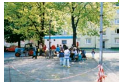
Aktive Bürgerbeteiligung vor Ort