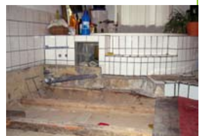
Während der Badsanierung