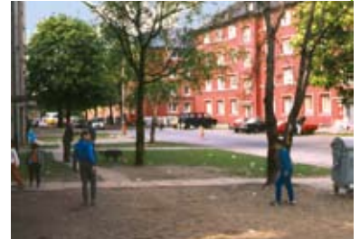
Freiflächen vor der Sanierung

* Projekt im Rahmen der Tätigkeit als Geschäftsführer des Planungsbüros A.S.L in Kassel.