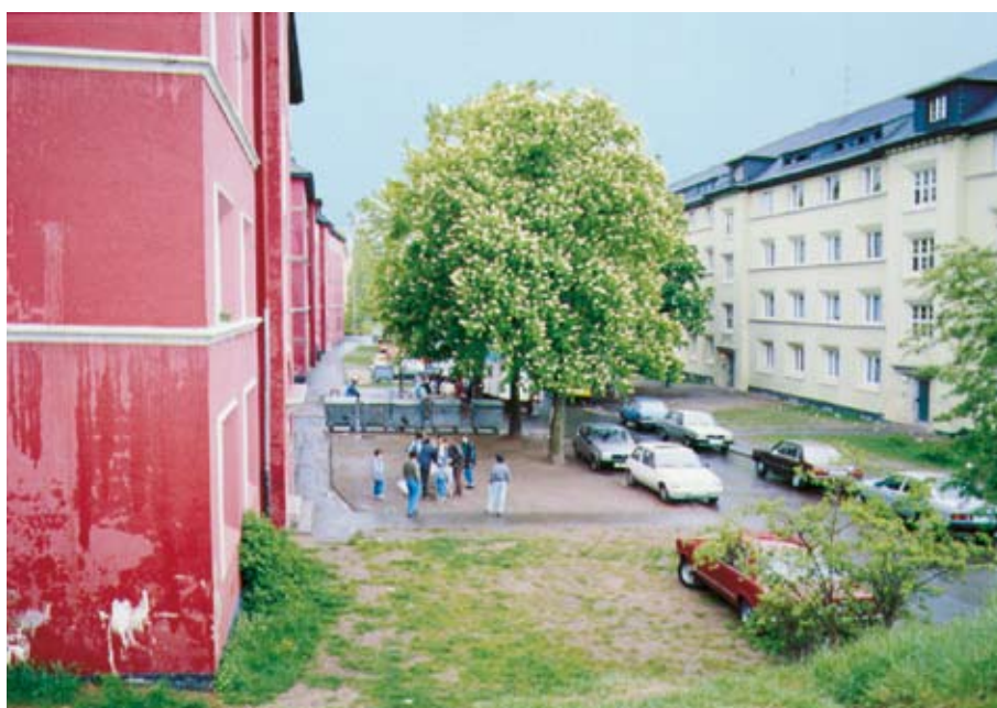
Ortsbegehung im Vorfeld der Planungsphase