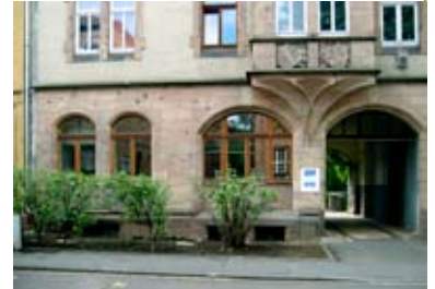
Erdgeschoss des denkmalgeschützten Vorderhauses in der Gottschalkstraße