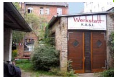
Werkstatt am Hinterhaus