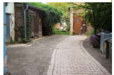
Der Hof des Hauses nach der Sanierung der Abwasserleitung